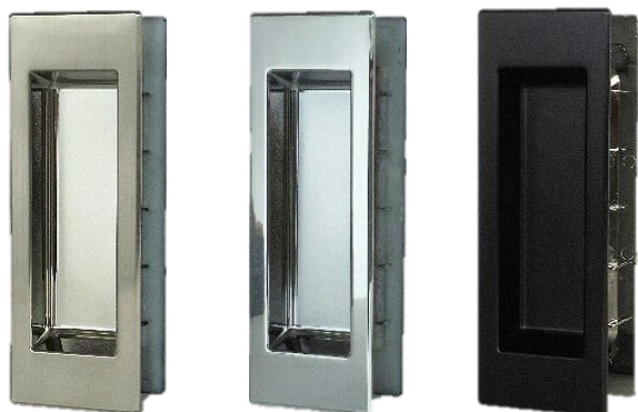
サテンニッケル(NI) 鏡面クローム(CR) ブラック塗装(BK)